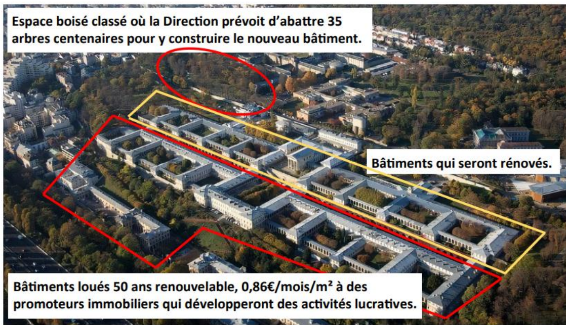
Photo aérienne des Hôpitaux de Saint-Maurice.